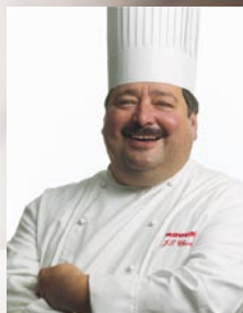
par Jean-Paul Chevré Conseiller Culinaire